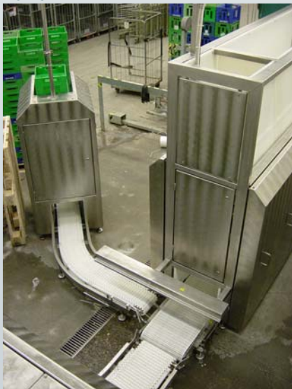
Nedstakker med autom. Frasortering af små kasser

6 kassestakke trækkes automatisk ind i nedstakker hvor de samtidig nedstakkes. Kasserne vendes, tømmeres for restindhold og føres gennem vaskekabinen. Her spules kasserne med recirkuleret 40-60°C sæbeopløsning ved ca. 7 bars tryk. Efterfølgende skylles kasserne i et vandbesparende skyllesystem hvor hovedparten af vandet recirkuleres og løbende udskiftes med rent vand.